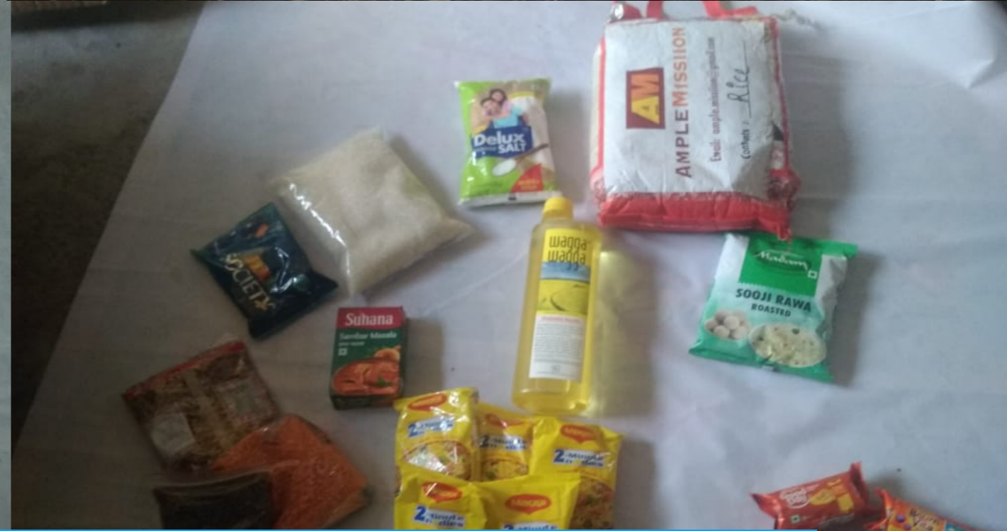
Sample Cleaning Kit & Food Kit & Hygiene Kit