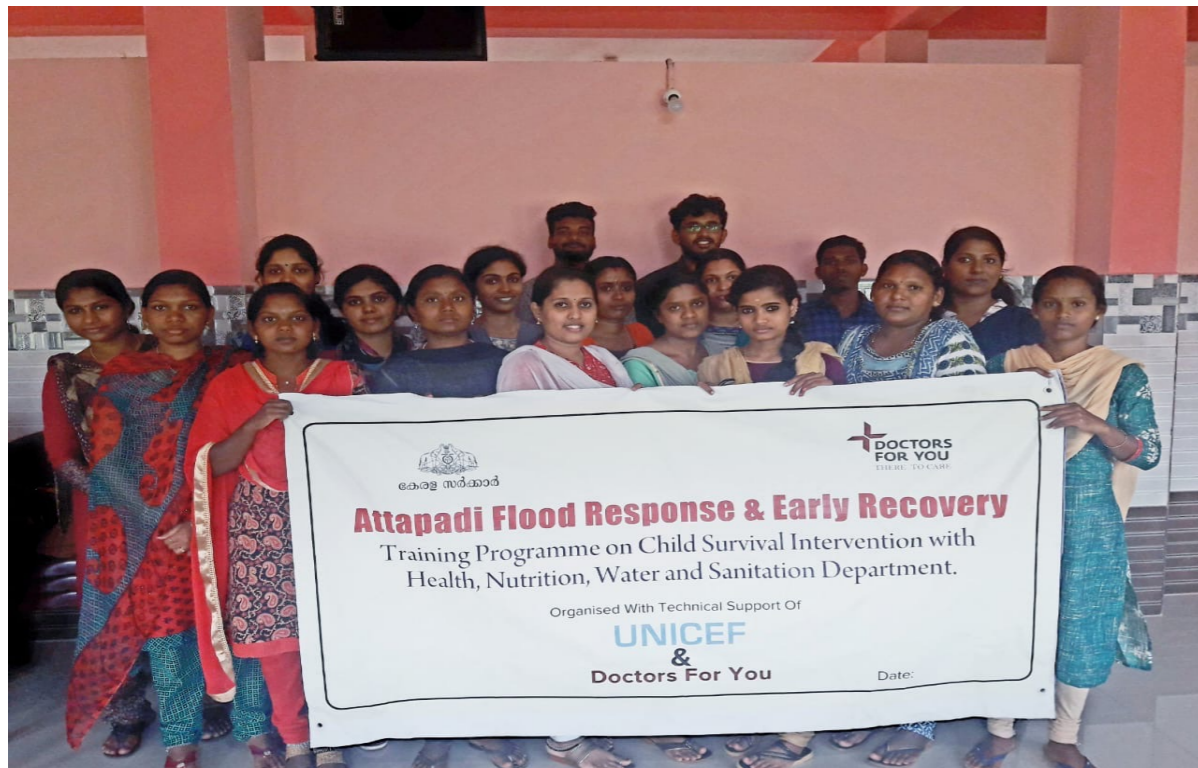
Training of Trainers for Field Officers (18th September 2018)