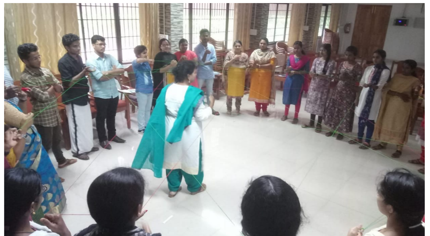
Social Behaviour Change Communication – Disaster Risk Reduction (SBCC-DRR) Program to all Block Managers (17th-18th Sep 2018)