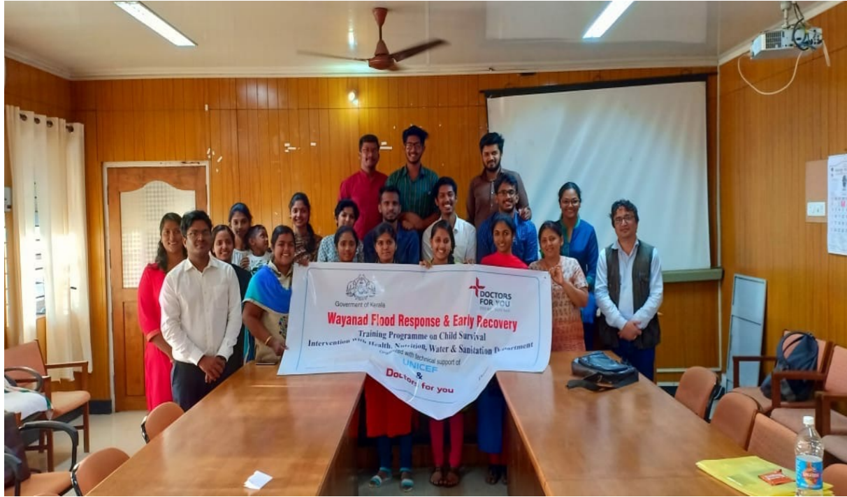
Master TOT Conducted for 22 DFY staffs (3rd-4th Sep)