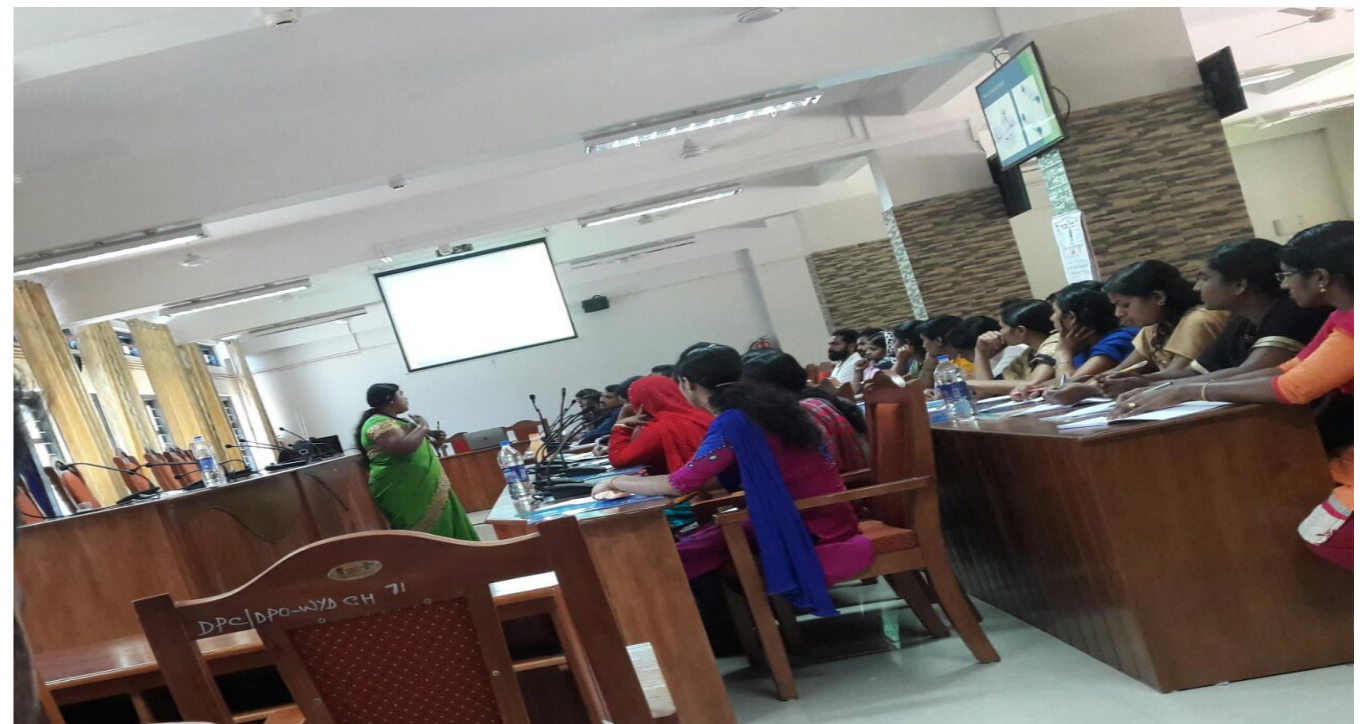
ToT conducted for 61 Field Officers (11th-12th Sep 2018)